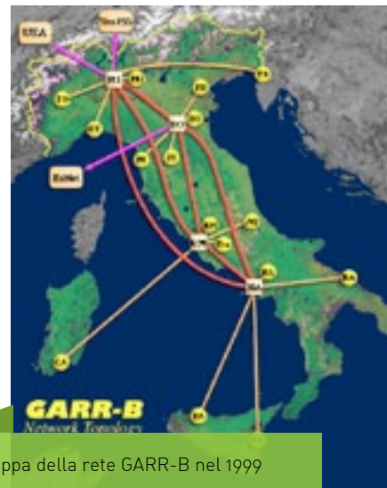
La mappa della rete GARR-B nel 1999

Nel dicembre 1990, accanto alla Commissione GARR nata nel 1988, il MURST istituì una Commissione per il Calcolo Scientifico per promuovere lo sviluppo del calcolo scientifico ed aumentare le potenzialità dell'infrastruttura di rete nonché ottimizzare le risorse finanziarie a disposizione. Queste due commissioni confluirono nell'aprile del 1993 nella Commissione per le Reti e il Calcolo Scientifico, che si dotò poco dopo, nel gennaio del 1994, di un organismo in grado di fornire pareri sulla rete GARR e che rappresentasse un punto di riferimento operativo per la rete nazionale della ricerca.