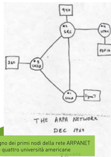
Il disegno dei primi nodi della rete ARPANET presso quattro università americane

ricerca che lavoravano a esperimenti diversi. Con l'ideazione di un sistema intuitivo per consultare delle informazioni attraverso una navigazione ipertestuale, l'accesso ai contenuti in rete diventò alla portata di tutti e non solo dei tecnici.