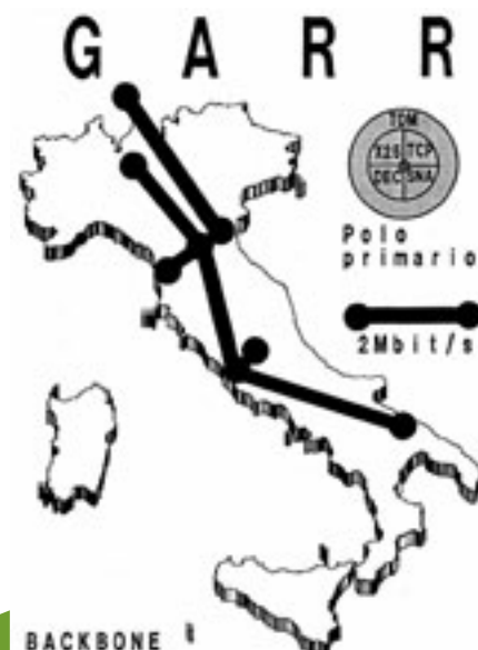
La mappa della prima dorsale di rete GARR, operativa a partire dal 1991.

La rete fu riconosciuta in campo internazionale come una delle più avanzate in termini di concezione e prestazioni e fu realizzata in modo da adattarsi facilmente agli sviluppi futuri.